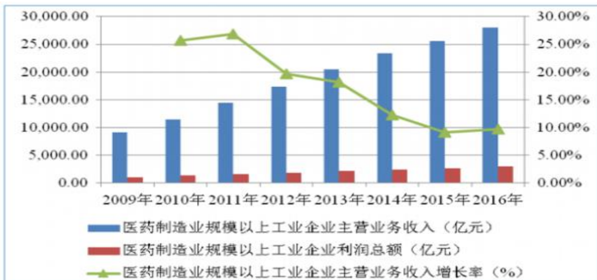
2009 年-2016 年医药制造业企业经营情况

根据国家统计局的统计，2016 年我国医药制造业（规模以上企业）实现主营业务收入 28,062.90 亿元，较上年同期增长 9.7%；2016 年实现利润总额 3,002.90 亿元，较上年同期增长 13.9%。与之前销售收入、利润总额的高速增长相比，医药制造业增速已经明显放缓，但基于我国人口结构老龄化、全面放开二胎政策、医改政策继续深入、人均收入水平提高等因素的影响，“十三五”期间医药制造业将长期维持在中高速平稳增长的新常态。